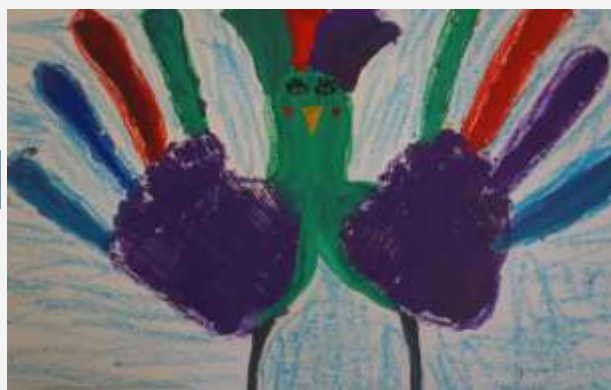
Конопелькина Анастасия, 4 кл.