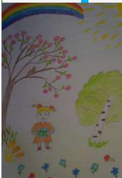
Корлякова Елизавета, 3 кл.