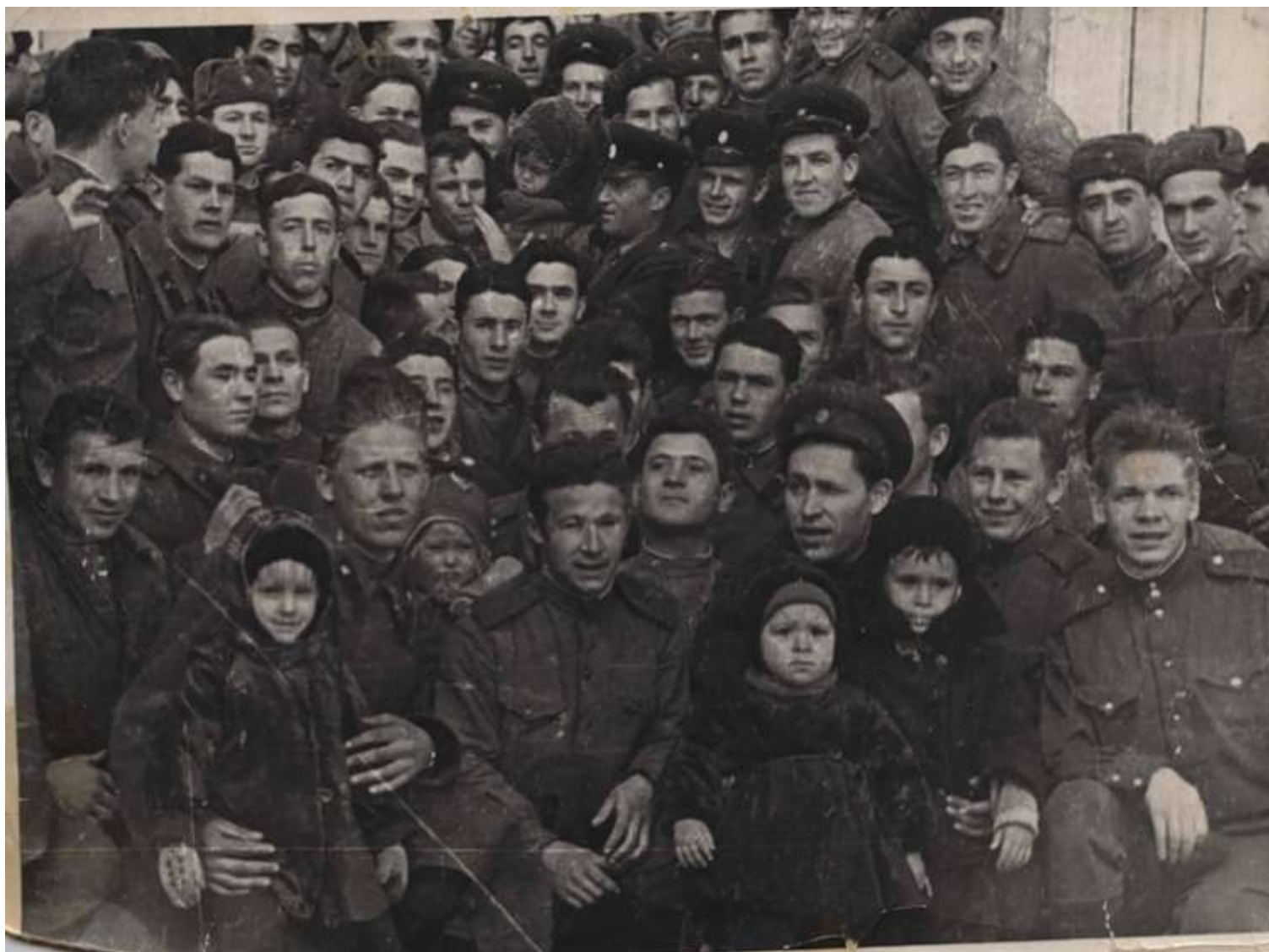
На Энгельском аэродроме