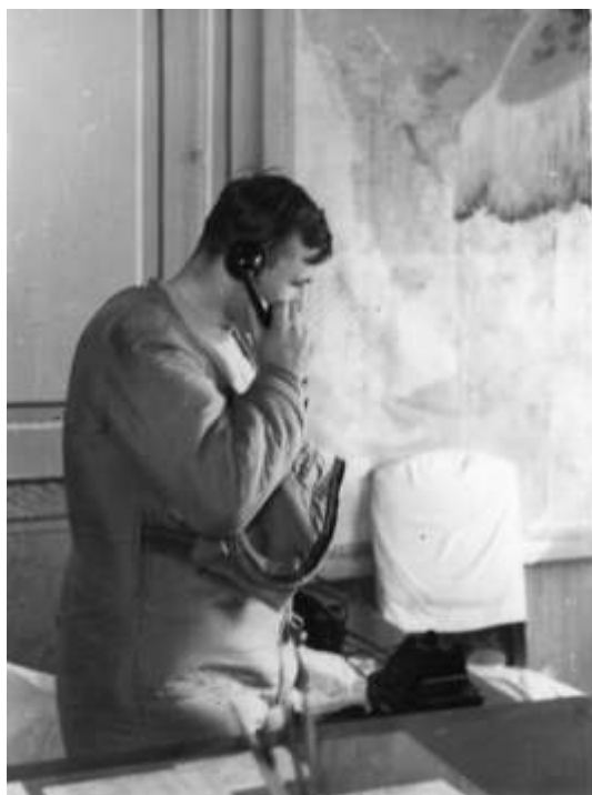
Доклад в Москву

На месте приземления спускаемого аппарата была установлена табличка с надписью: «Не трогать 12.04.61». В скором времени она пропала, вероятнее всего, местные жители взяли ее на память, а столбик простоял еще целый год.