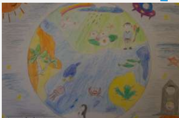
Алексеев Лев, 2 кл.