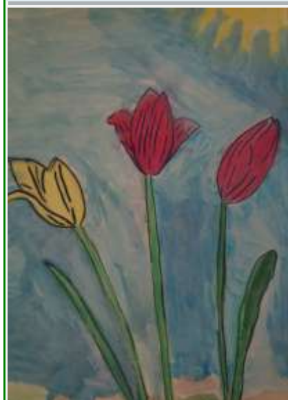
Жаркова Мария, 1 кл.