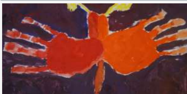
Беляев Артем, 1 кл.