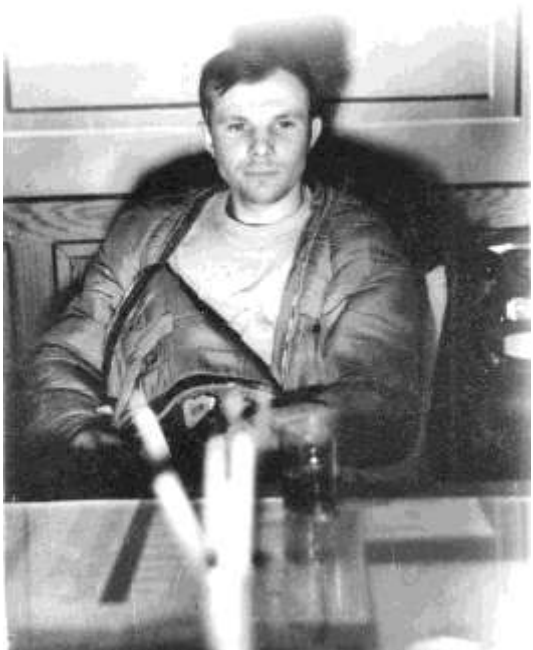
Ю. А. Гагарин на авиабазе «Энгельс» через час после приземления

Ю. Гагарин чувствовал себя необычно, видимо, он всё никак не мог поверить, что вернулся живым и невредимым, что находится на Земле среди людей». Вскоре после приземления к месту событий прибыли военные из дивизиона и местные колхозники. Одна группа военных взяла под охрану спускаемый аппарат, а другая повезла Гагарина в расположение части.