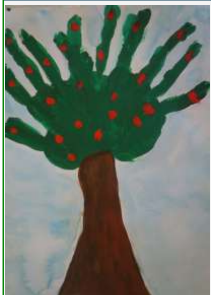
Красовская Надежда, 4 кл.